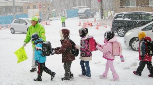
清田小学校近く 旧36号線