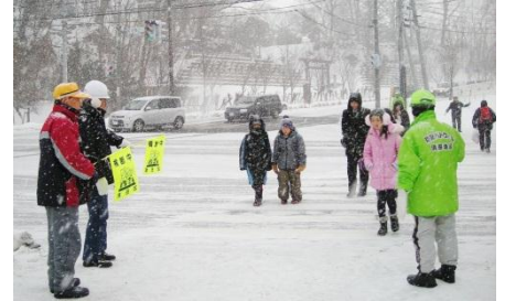
平岡2条1丁目交差点

雪 の降る凍てつく朝、午前8時前、登校する小学生や高校生が増えてくる通学路や交差点で、交通安全指導員や町内会の人達が事故から子ども達を守る活動を行っています。2, 3人で遊びながら歩いてくる子、「おはよう」と駆け寄る子、ふざけて滑って転ぶ子、朝のラッシュ時、子ども達に「おはよう」と声をかけながら、冬も夏も学校のある日は、毎日立ち続けています。子ども達から「おはよう！」の声をもらうのが一番うれしく元気をもたらえると言っていた笑顔が印象的でした。