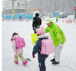
声かけしながら見守り